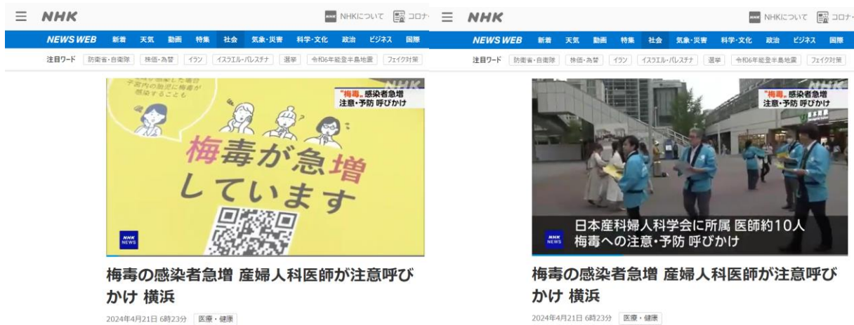
【写真①②：NHK ニュースに取り上げられた様子】

NHK ニュース URL : https://www3.nhk.or.jp/news/html/20240421/k10014428541000.html