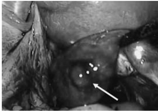
(図3) 卵管膨大部の破裂部