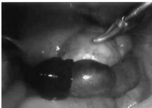
(図 2) 腫大した卵管と卵管采に付着した血腫

術後経過：血中 hCG 値は術後 1 日 6,326IU/l、術後 4 日 710IU/l、術後 6 日 278IU/l と順調に低下し術後 7 日目に退院となった。術後 13 日 27IU/l、術後 53 日に月経が再来した。術後 3 カ月後体外受精・胚移植施行、子宮内妊娠成立し外来通院中である。