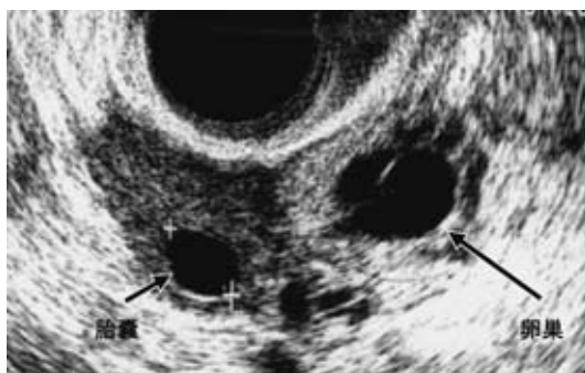
(図1) 右卵巢と卵管内の血腫と胎嚢像